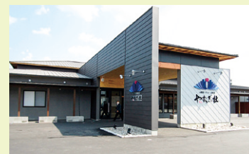
プリエール杵築 やすらぎの杜

令和8年2月17日(火) 9:30～13:00(受付開始 9:00～) プリエール杵築やすらぎの杜(杵築市杵築665-57) TEL: 0978-63-1500