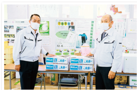
高糖度かんしょ「甘太くん」の焼きいも贈呈

災害救助法適用地域の契約者・利用者の方へ、共済金請求手続きの簡素化や掛金払込延長などの特別措置を行っております。詳しくは、最寄りの支店へお問い合わせください。