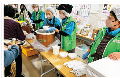
JAおおいた大分市女性部による炊き出しの支援