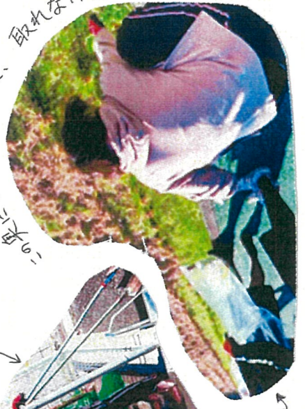
「お集まり」に、取れな〜〜〜。★