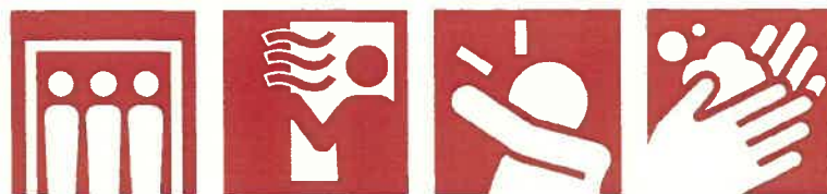
密室回避 換気 咳エチケット 手洗い