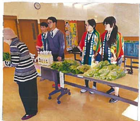
♪あみごとうりごんごまじった!!

今回ご好評いただきましたことにより、坂、市支店としても地域のみなさまとのコミュニケーションの場として、第2回農産物販売会が開催できればと考えておりますので、その時はまたご来場をお待ちしています。