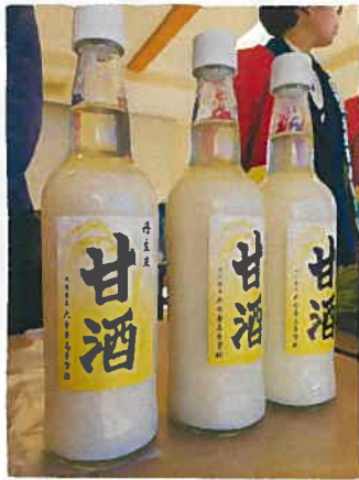
丹生米を使った甘酒

前月号でのお知らせと窓口での声かけもあったのか、当日は販売開始時刻より早くから多くのお客様がその時を楽しみにしてくださっていたようです。