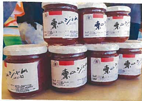
毎とイネジクのジャム 2種類 1個 400円でした。

みなさまそれぞれお目当ての品物を手に取られながら、1人で大量に購入してくださった方もいらっしゃいました。おかげさまで2日間とも大盛況で用意していた商品はほぼ完売しました。足を運んでいただいたみなさま、本当にありがとうございました♡