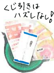
じり引きは ハズレなし!

「年金はどこで受取っても 一緒」を思っていますか? JAでは窓口でのじり引きや スポーツ大会など年金を受け取っている方 限定のイベントをご用意しております! 変更手続は簡単です! JA窓口にお声かけください😊