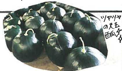
ツヤツヤ の尺玉 西瓜

「生産技術が進歩し、より安定して生産できるようになりました。 良いものを作って売るというのは当たり前前の時代です。日田のスイカ をブランドにしていけるように頑張りたいです。」と話してくれま した。 尺玉西瓜は現在、元気の馱やかんほの宿で購入できます。 みなさんも食べてみませんか?