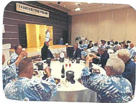
お楽しみ抽選会もあり、大いに盛り上がりました。

会長さんの乾杯の 発声とともに宴が 始まりました。 カラオケで自慢ののどを 披露される方もいれば