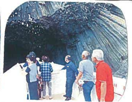
青い海に浮かぶ洞窟は神秘的でした。