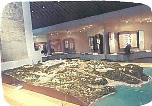
名護屋城跡・博物館