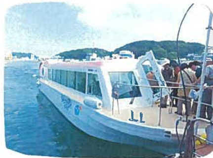
青い海に浮かぶ洞窟は神秘的でした。