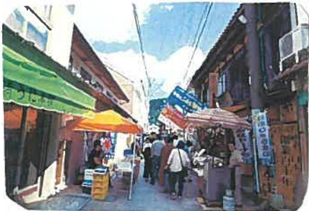
日本三大朝市で有名です💎